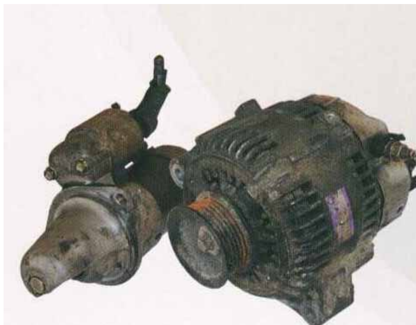
回収されたコア部品